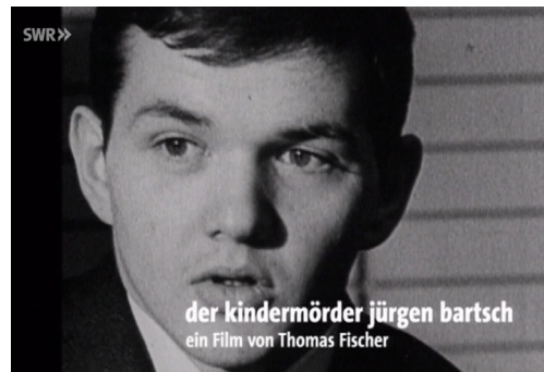
Der »Fall Bartsch« im Infotainment-Format: Startsequenz der im Jahr 2000 in der ARD gesendeten Filmdokumentation »der kindermörder jürgen bartsch«