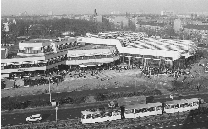
Das Sport- und Erholungszentrum (SEZ) in Berlin-Friedrichshain, Foto vom Dezember 1987

Der gesundheitspolitisch motivierte Aufruf für mehr Bewegung stand allerdings im Kontrast zur real existierenden Infrastruktur des Breitensports in der DDR. Während der Leistungssport in den 1970er- und 1980er-Jahren zahlreiche internationale Erfolge vorweisen konnte, befand sich der Breitensport in einer großen Krise. Seit dem Sportstätten-Bauboom der 1950er- und 1960er-Jahre war kaum noch in die entsprechende Infrastruktur investiert worden. Das 1981 eröffnete SEZ war die symbolträchtige Ausnahme. Im Allgemeinen waren Sportplätze, Hallen, Schwimmbäder, wie es in der einzigen veröffentlichten Bestandsaufnahme von Sporteinrichtungen 1986 hieß, in einem »mangelhaften Bau- und Nutzungszustand« und daher nur eingeschränkt verwendbar. 53 Zusammen mit den bereits erwähnten Mängeln in der Sportausrüstung ergibt sich ein defizitäres Bild des Breitensports.