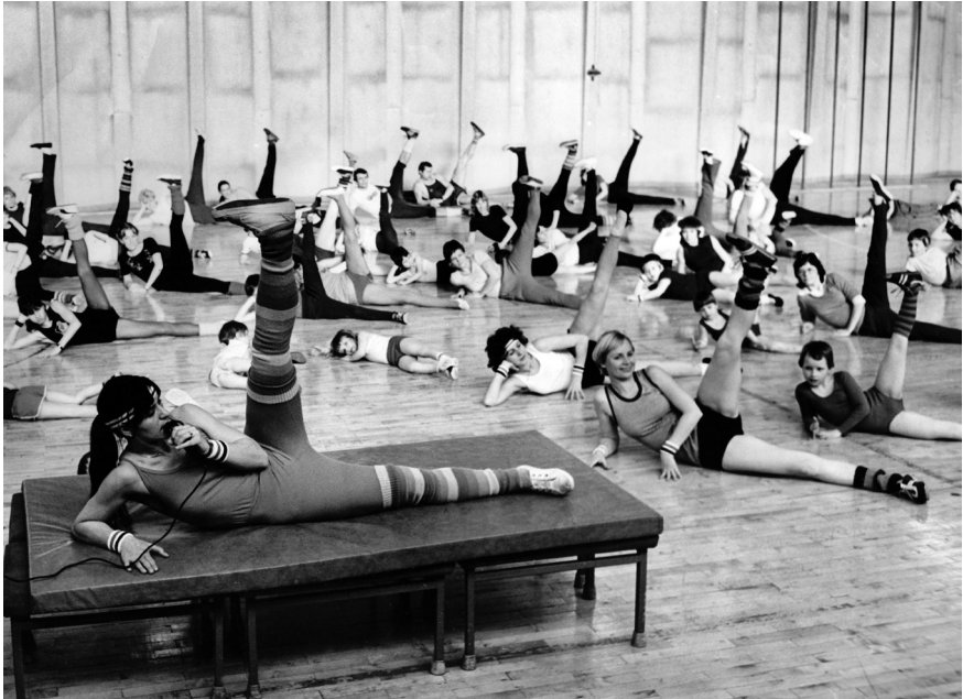
Frauen, Kinder, Jugendliche und einige Männer bei »Popgymnastik«-Übungen in Halle/Saale, 1980er-Jahre

»Medizin nach Noten« Mitte der 1980er-Jahre. Die Sendung sollte, mit neuem »Pfiff« versehen, im Wettstreit mit dem Westfernsehen konkurrenzfähig oder sogar überlegen sein. Zugleich sollte ein Millionenpublikum zum Sport animiert werden.