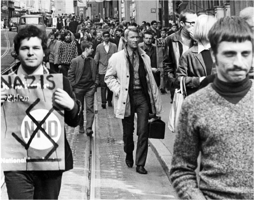
Heidelberg, 4. April 1968: »Spaziergangs-Demonstration« von Studentinnen und Studenten, Schülerinnen und Schülern im Vorfeld der baden-württembergischen Landtagswahl vom 28. April 1968. Die NPD erreichte bei dieser Wahl 9,8 Prozent der Stimmen.

der Autor auf den Zeitdruck hin, denn »zu Recht« hatte der S. Fischer Verlag wegen der bevorstehenden Bundestagswahl darauf gedrängt, »noch im Sommer 1969 das Ergebnis zu veröffentlichen« (S. 11). Anderes, insbesondere Niethammers Dissertationschrift über die »Entnazifizierung in Bayern«, 9 musste hingegen warten. Zwei Jahre später wurde er bei Werner Conze in Heidelberg promoviert, einem der frühen Impulsgeber der Sozialgeschichte. 10