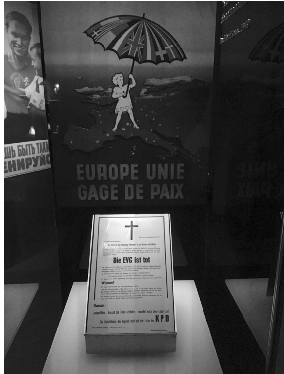
Beispiel einer gelungenen Inszenierung von Objekten im Haus der europäischen Geschichte: pro-europäisches Plakat als Hintergrundbild für eine »Todesanzeige« der Europäischen Verteidigungsgemeinschaft aus der Feder der Kommunistischen Partei Deutschlands vom 6. September 1953.

Schaut man sich die Periodisierung und die thematischen Schwerpunkte an, so wird zwischen den Zeilen eine klassische Modernisierungsgeschichte Europas erzählt, die jedoch die dunklen Seiten dieser »Erfolgsgeschichte« nicht ausblendet (Kolonialismus, Weltkriege, Holocaust). Genau dieser Fokus auf die zivilisatorische Dimension europäischer Geschichte – samt ihren Brüchen und globalhistorischen Spannungsfeldern – lässt das spezifisch Neue der Nachkriegsgeschichte Europas unterbelichtet, nämlich die politischen Integrationsbemühungen sowie ihre institutionellen, juristischen, ökonomischen und soziokulturellen Folgeerscheinungen. Die Darstellung des europäischen Einigungsprozesses beschränkt sich auf die oftmals recht lieblose Schautafel-Chronologie von »Meilensteinen der europäischen Einigung«, welche die Komplexität dieses in der europäischen Geschichte absolut neuartigen Phänomens nur bedingt reflektieren. Die in der jüngeren Integrationsgeschichtsschreibung problematisierten