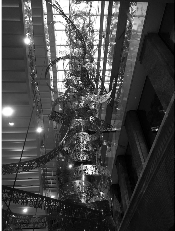
Die »Zitatenranke« als Doppelhelix des europäischen Kulturerbes?

zentralen Navigationsgerät zu, welches man am Eingang des Hauses nach Abgabe seines Personalausweises überreicht bekommt: ein Tablet samt Kopfhörer, die gleichermaßen als Audioguide und interaktive Schnittstelle zur Aneignung objektgebundener Informationen der präsentierten Sammlung dienen. Liegen die Vorteile eines Tablets als interaktives und multimediales Informationsmedium sprichwörtlich auf der Hand (zum Beispiel können sämtliche Informationen in den 24 Amtssprachen der Europäischen Union abgerufen werden), so irritiert die Tatsache, dass in der Ausstellung auf jegliche noch so knappe Beschriftung der Objekte verzichtet wird. Nur mithilfe des Tablets können Besucher kurze Informationen zur Bedeutung, zeitlichen Einordnung und Herkunft von Ausstellungsobjekten erhalten.