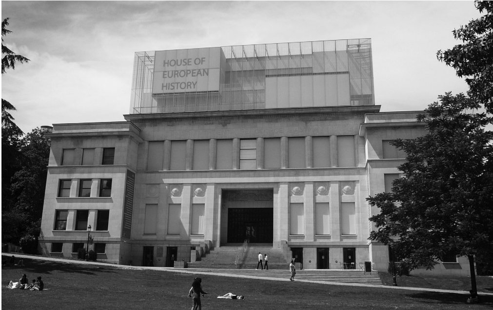
Das Haus der europäischen Geschichte, Außenansicht vom Juli 2017