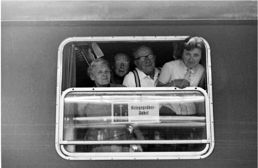
VDK-Reise nach Pomezia (Italien), 25. Mai – 1. Juni 1966

Masse abzusetzen, und definierten sich selbst nicht als Touristen, sondern als Reisende. 4 Die Unterscheidung zwischen Pilgern und Touristen wurde von Historikerinnen und Historikern in den genannten Zusammenhängen häufig als Beschreibung übernommen, ohne sie empirisch näher zu prüfen. 5