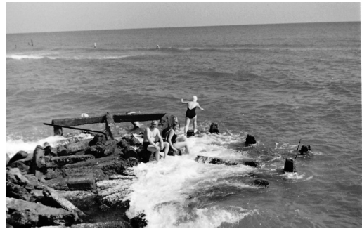
VDK-Reise nach Pomezia (Italien), 25. Mai – 1. Juni 1966. Die gezeigten Bilder befinden sich alle auf demselben Film.

die ehemaligen Schlachtfelder als auch die Soldatengräber als heilig bezeichnet wurden. 65 Durch die Praktiken der Erfahrungsgemeinschaft, vor allem durch Gespräche und Austausch mit anderen, blieben die Reisenden auch den Rest der Fahrt über Trauernde. Gleichzeitig waren sie Touristen, die das entsprechende Angebot der Volksbundreisen nutzten. Diese beiden Rollen ließen sich offenbar ohne weiteres miteinander verbinden, wie nicht zuletzt Fotos von Volksbundreisenden dokumentieren, die nebeneinander sowohl Soldatengräber als auch die Reisegruppe und touristische Aktivitäten wie das gemeinsame Bad im Meer zeigen. Durch die Erfahrungsgemeinschaft, die soziale Funktion, waren die touristische und die memorierende Funktion der Reisen ineinander verschränkt.