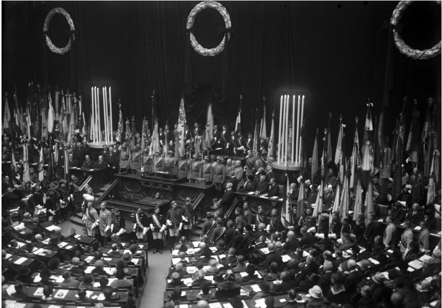
Feier des Volkstrauertags im Reichstag am 13. März 1927 (Bundesarchiv, Bild 102-03940,)

das Gedenken an die Kriegstoten zu wahren. Anders als sein britisches oder amerikanisches Pendant ist er keine staatliche Organisation, sondern ein gemeinnütziger Verein, der sich aus Mitgliedsbeiträgen und Spenden, aber auch aus Steuermitteln finanziert. Der Volksbund versteht es als eine seiner wesentlichen Aufgaben, Grabstätten für deutsche Soldaten und Kriegstote im In- und Ausland anzulegen und dauerhaft zu pflegen. Als weitere Aufgabe übernahm er die Gestaltung des Volkstrauertags, den die Weimarer Republik 1922 auf Vorschlag des VDK hin einführt und den auch die Bundesrepublik als Gedenktag begeht (seit 1952 immer an dem Sonntag zwei Wochen vor dem 1. Advent). So fanden bzw. finden in beiden Staaten vom Volksbund gestaltete Gedenkstunden im Parlament sowie zahlreiche Gedenkfeiern an Kriegsgräbern und Kriegerdenkmälern statt. 7