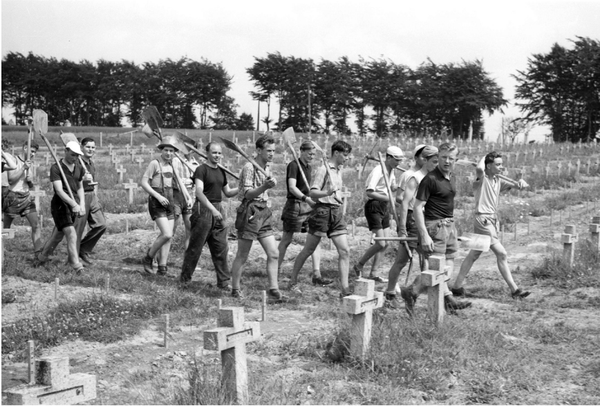
Schon in den 1950er-Jahren war der Volksbund auch in der Jugendarbeit aktiv. Internationales Jugendworkcamp des CVJM und des Kolpingwerkes mit dem VDK in Recogne-Bastogne (Belgien), Sommer 1956

von einer Vielzahl verstreuter Gräber auf neu angelegte zentrale Kriegsgräberstätten umzubetten. In den ersten Jahrzehnten nach Kriegsende lag der Arbeitsschwerpunkt auf diesen Umbettungsarbeiten sowie der Schaffung und Einweihung immer neuer Sammelfriedhöfe für deutsche Soldaten im westlichen Ausland. 1973 unterhielt der Volksbund dort 400 deutsche Soldatenfriedhöfe des Ersten und Zweiten Weltkriegs mit rund 1,4 Millionen Gräbern. 15 Die ersten »Gesellschaftsfahrten zu Kriegsgräberstätten« fanden 1950 nach Sandweiler in Luxemburg, Lommel in Belgien und zu diversen Friedhöfen in Italien statt. 16 In den 1950er- und 1960er-Jahren folgten Einweihungsfahrten zu zahlreichen weiteren Friedhöfen in Nord-, West- und Südeuropa sowie in Nordafrika.