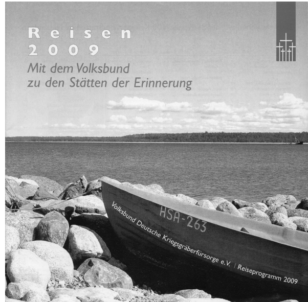
links: Deckblatt eines Reiseprogramms, verwendet für VDK-Reisen seit den 1980er-Jahren rechts: Titelbild des VDK-Reisekatalogs 2009

Auslandsreisen wurden seit den 1970er-Jahren für immer mehr Bundesdeutsche aller Altersstufen zu einem selbstverständlichen Konsumgut. Das traf auch auf einen Teil der VDK-Reiseklientel zu, die nun routiniertere Ansprüche an das touristische Programm stellte. So beschwerte sich eine Teilnehmerin einer Reise nach Frankreich 1984: »Wegen der zu erwartenden Schönheiten der ausgeschriebenen Route habe ich bewußt diese Reise im Juni gewählt. Leider wurde[n] ich und die Mehrzahl der älteren Mitreisenden vielseitig enttäuscht, in der Hauptsache durch die Unfähigkeit unseres Busfahrers.« Wegen der fehlenden Ortskenntnisse des Fahrers sei die Reisegruppe um die schönsten Strecken und Ziele gebracht worden – in diese Kritik stimmten auch andere Teilnehmer ein. 69