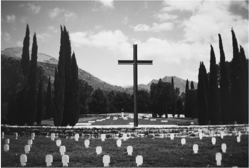
Deutsche Kriegsgräberstätte Cassino (Italien) mit 20.000 Gräbern, angelegt 1959–1964

Vergessenheit anheimfallen zu lassen. Dies gelang weitgehend: Zahlreiche im Vernichtungskrieg gegen die Sowjetunion, vor allem während der Kämpfe um Stalingrad getötete deutsche Soldaten galten als vermisst, ohne dass die genauen Todesorte oder -tage bekannt waren. Die westdeutschen Angehörigen hatten keine Möglichkeit, Gewissheit über den Tod oder Informationen über die Todesumstände ihrer Verwandten zu bekommen. Selbst wenn sie die Grablagen wussten, erhielten sie keine Genehmigung, die Orte zu besuchen. 17 Als die Bundesregierung 1992 ein Kriegsgräberabkommen mit Russland und anderen Staaten der ehemaligen Sowjetunion schloss, waren die meisten Gräber unauffindbar, überbaut oder zerstört. 18 Auf den deutschen Kriegsgräberstätten in Russland werden deshalb auch die Namen aller Vermissten verzeichnet, deren Leichen nicht mehr geborgen werden können. 19