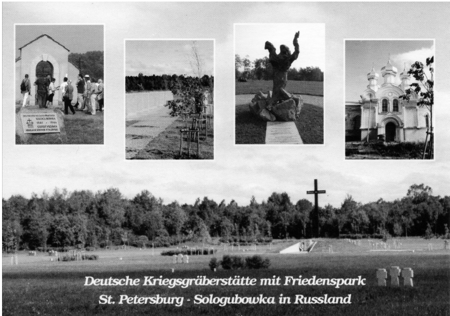
Deutsche Kriegsgräberstätte Sologubowka bei St. Petersburg mit derzeit rund 55.000 Gräbern, eröffnet im Jahr 2000. Postkarte des VDK

von denen es drei zum Besuch freigab. 25 Die Reisen zu den Kriegsgefangenenfriedhöfen blieben rund zehn Jahre im Programm und wurden seit 1992 allmählich von Reisen zu den Kriegsgräberstätten abgelöst, die der Volksbund in den Ländern der ehemaligen Sowjetunion anlegte. Die Umbettungs- und Bauarbeiten in Osteuropa binden seitdem den größten Teil der finanziellen und personellen Kapazitäten des VDK. Während es in anderen Ländern lediglich um den Erhalt bestehender Friedhöfe geht, ist die Anlage neuer Kriegsgräberstätten in Osteuropa noch nicht abgeschlossen. 26 Derzeit (Stand Dezember 2016) betreut der VDK 833 Friedhöfe (518 davon in Osteuropa) mit 2,7 Millionen Kriegsgräbern in 46 Ländern. 27 Auch der geographische Schwerpunkt der Reiseangebote verlagerte sich in den letzten 15 Jahren nach Osteuropa. Im Zeitraum 1999–2009 führten dorthin rund zwei Drittel aller Volksbundreisen. 28