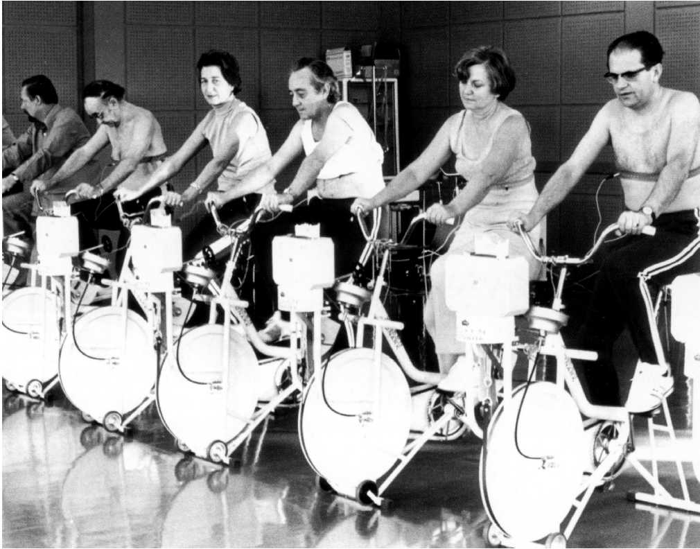
Ergometer-Training als kardiologische Bewegungstherapie und »Anti-Stress-Übung« in der Klinik Höhenried, 1970er-Jahre (aus: Höhenried. Schloss und Klinik in Geschichte und Gegenwart. Festschrift anlässlich des 40-jährigen Jubiläums der Klinik Höhenried im Jahr 2007, München 2007, S. 100. Das Foto war auch im erwähnten »Spiegel«-Artikel abgedruckt, siehe Anm. 5.)