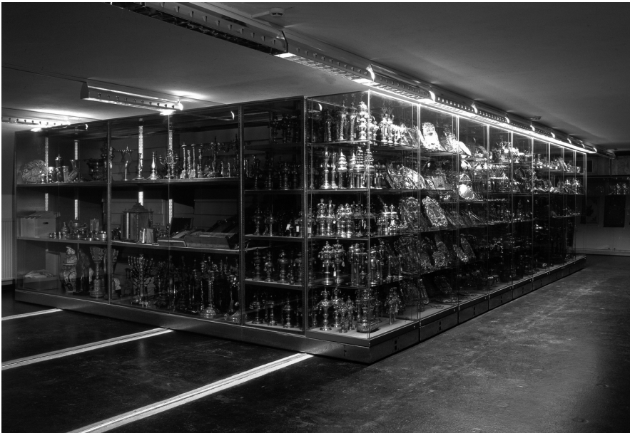
Die Sammlung von Judaica im Schaudapot des Jüdischen Museums Wien verweist auf die Abwesenheit der einstigen Besitzer und Nutzer.

Judaica können als Museumsexponate eine neue soziale Bedeutung gewinnen: Abgesehen von der jüdischen Religion und einem einzigartigen Kunsthandwerk zeugen sie als Überreste von zerstörten Lebenswelten. Zur Ausstellung des Jüdischen Museums Wien gehört ein Schaudapot, in dem einige Objekte mit Spuren der Vernichtung – verkohlt, deformiert, fragmentiert – direkt auf die nationalsozialistische Gewaltgeschichte verweisen. Es geht um die visuell erfahrbare Biographie des Objektes, seinen zeitgeschichtlichen Zeugniswert, nicht um seine ursprüngliche Gebrauchsfunktion. Dass es letztendlich im Museumsdepot gelandet ist, liegt in der Zerstörung jüdischen Lebens begründet.