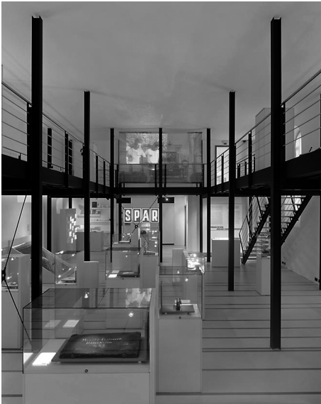
Unter dem Titel „Spurensicherung“ zeigt die ehemalige Synagoge Haigerloch jüdisches Leben vor Ort und die „Umnutzung“ des Gebäudes nach 1938.

Haigerloch, die in der Nachkriegszeit erst als Kino, später als Supermarkt genutzt wurde, und das Jüdische Museum Schnaittach. Die ehemalige Synagoge der kleinen Landgemeinde Schnaittach ist eine Dependence des Jüdischen Museums Franken. Wie die meisten Synagogen wurde auch sie am 9. November 1938 ausgeraubt und erheblich zerstört. Während die letzten im Ort lebenden Juden deportiert wurden, gelang es dem Leiter des Heimatmuseums, das Gebäude vor dem Niederbrennen zu retten. Aus eigenem Interesse: Er erhielt es als Sitz seines Museums und dazu noch zahlreiche Ritualgegenstände für seine Sammlung. Im kollektiven Gedächtnis des Ortes verankerte sich diese Einverleibung als Rettung. Statt den Vorkriegszustand der Synagoge wiederherzustellen, wurde in Schnaittach Mitte der 1990er-Jahre eine Konzeption erarbeitet, die die Geschichte der Sammlung und des Gebäudes selbst zum Thema der Ausstellung und zentralen Exponat macht.