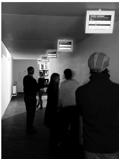
Die Installation „Stimmen“ in der neuen Dauerausstellung in München verbindet gegenwärtige und vergangene Erfahrungen von Migration.

3.4. Aktualität statt Epilog. Wird die Nachkriegsphase jüdischer Geschichte in Deutschland vielerorts zumeist nur als ein Epilog nach dem Holocaust präsentiert, zum Beispiel durch die Darstellung der jüdischen Displaced Persons, geht in neuere Ausstellungen vermehrt ein anderes Verständnis von jüdischer Geschichte ein. Zum einen werden Identitäten zunehmend als gleichzeitig partikular und situativ, als offen und changierend begriffen. Zum anderen stehen gerade die transnationale Geschichte und die Erfahrungen von Migration und Diaspora hoch im Kurs des Ausstellungswesens. Mit seiner Dauerausstellung „Stimmen_Orte_Zeiten“ legt das Jüdische Museum München nun einen neuen Schwerpunkt auf die Gegenwart jüdischen Lebens in Deutschland. In der Sequenz „Stimmen“ kommen verschiedene Immigranten unterschiedlicher Zeiten zu Wort, die von ihren Erfahrungen erzählen. Die Form der Präsentation weckt Assoziationen an ein Flughafenterminal und damit an fortwährendes Unterwegssein. Auch die neue Dauerausstellung in Hohenems stellt individuelle Erfahrungen in den Kontext einer europäischen Geschichte von Migration und fragt nach der Zukunft einer europäischen Einwanderungsgesellschaft.