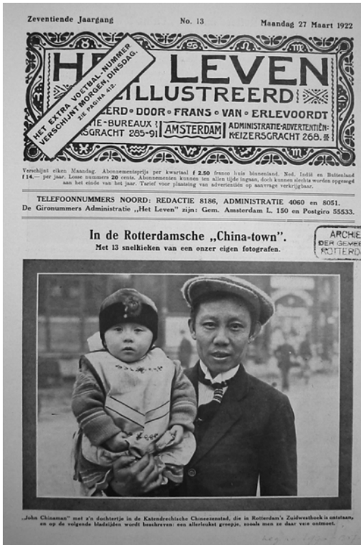
Titelseite einer Foto-Reportage der Zeitschrift „Het Leven“ über das Chinesenviertel in Rotterdam 1922

Die Entwicklung der chinesischen Migration nach Westeuropa verlief jedoch nicht gleichmäßig; der Erste und der Zweite Weltkrieg stellten jeweils eine erhebliche Zäsur dar. Während die Beschäftigung chinesischer Seeleute in den Niederlanden und in England nach 1914 kriegsbedingt zunahm, galten die 300 in Bremerhaven und Hamburg festsitzenden chinesischen Seeleute als eine Art Faustpfand auf deutscher Seite. 24 Die Chinesische Republik blieb anfangs neutral, gewährte seit 1916 aber die Anwerbung chinesischer Vertragsarbeiter durch die britischen und französischen Kriegsparteien. Insgesamt wurden über 130.000 chinesische „Kulis“ angeworben, die hinter der Front in Frankreich Schanzarbeiten verrichten oder in Fabriken arbeiten sollten. 25 Etwa 2.000