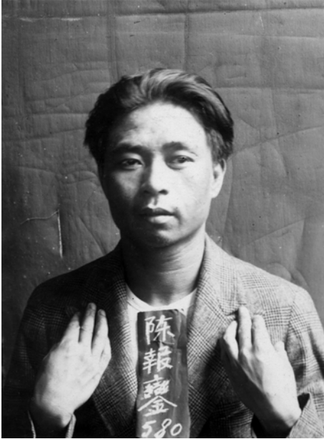
„Brilliant“ Chang nach seiner Festnahme in Hongkong 1935

vokation für die koloniale Hierarchie, da er sich ganz als Dandy gerierte, der sich im Pelzmantel mit jungen englischen Frauen an seiner Seite im Nachtleben der Metropole zeigte. Sexualität war hier unverkennbar zentral für die gesellschaftlichen Imaginationen, und chinesische Männer wurden zu einer Projektionsfläche gesellschaftlicher Verunsicherungen. Migranten wie Chang personifizierten den unerwünschten „Eindringling“, der sich nicht länger an die kolonialen Regeln des britischen Empires halten wollte.