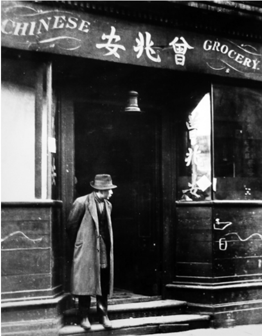
Chinesisches Gemüsegeschäft im Limehouse Causeway Anfang der 1930er-Jahre

Einwanderer blieb recht gering – in London wurden 1911 beispielsweise lediglich 247 chinesische Staatsangehörige statistisch erfasst, deren Zahl dann in den 1920er- und 1930er-Jahren trotz regelmäßiger Ausweisungen anstieg.