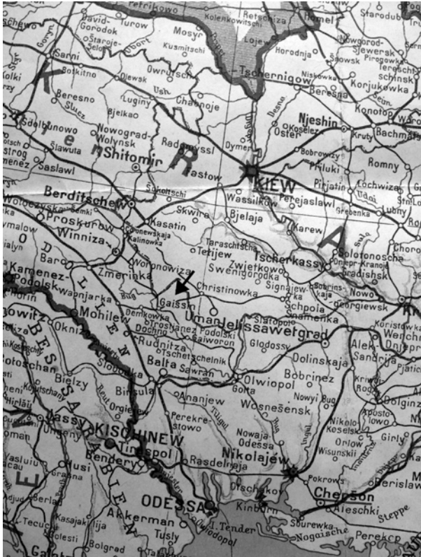
Die Kleinstadt Gajsin liegt südsüdwestlich von Kiev zwischen Uman und Winnica (Karte: Mittelbach's Verlag, Leipzig 1920).