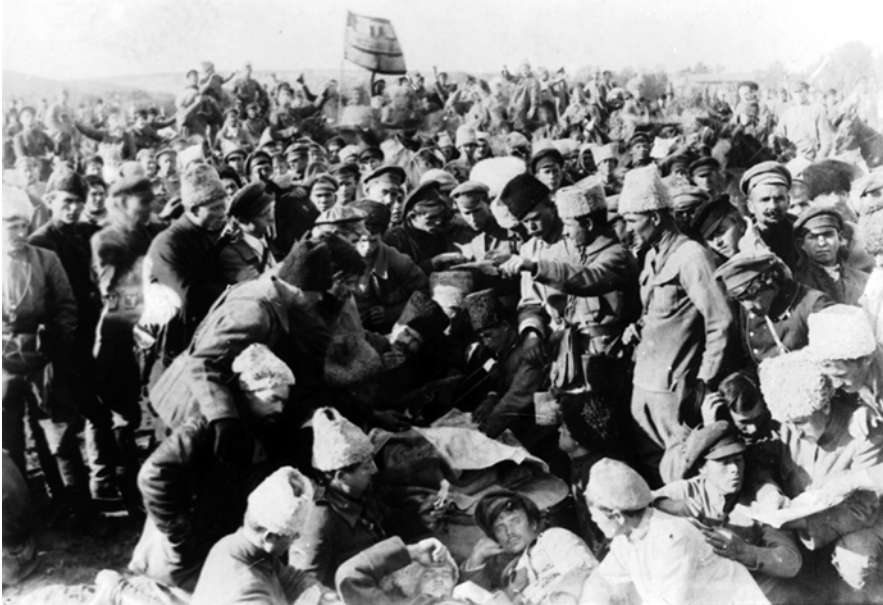
Versammlung von Soldaten einer Atamanenarmee – in diesem Fall der Machno-Armee