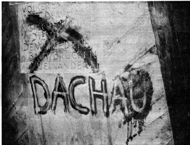
Ausgerechnet die Tafel mit der Inschrift „Völker entsagt dem Haß — Versöhnt euch, dienet dem Frieden — Baut Brücken zueinander!“ wurde an der Friedland-Gedächtnisstätte von den unbekanntem Tätern übermalt und durchgestrichen. Sie wollen keine Versöhnung und keinen Frieden, sondern den Haß lebendig halten, um weiterhin Zwietracht und Uneinigkeit zwischen den Völkern wachzuhalten. — Die zweite Tafel der Gedächtnisstätte, auf der das Wort Lidice geschrieben wurde, trägt die Inschrift: 2 340 000 Deutsche blieben im 2. Weltkrieg: 2 892 000 fielen als Soldaten, 2 846 000 Zivilpersonen und 1 250 000 Kriegsgefangene starben; verschollen blieben: 1 163 600 im Kampf, 100 300 in Kriegsgefangenschaft, 1 089 000 Zivilpersonen.“

Unbekannte Täter haben in einer Nacht zwischen Weihnachten und dem neuen Jahr die Friedland-Gedächtnisstätte besudelt und Zerstörungen verursacht. Mit grüner Leuchtschrift wurden, nach vorherigem Überlackieren mit einer sogenannten Lasur, auf das Mahnmal die Worte „Dachau“ und „Lidice“ geschrieben, wobei auch zwei der Gedenktafeln überschmiert wurden. Auch wurde ein Teil der Scheinwerferbatterien, mit denen das Mahnmal bei Dunkelheit angestrahlt wird, zerstört. Die Täter versuchten außerdem die Stahltür zum Glockenturm aufzubrechen. Das Mahnmal der Heimkehrer in Friedland ist ein Mahnmal der Versöhnung, das nicht nur den Opfern des 2. Weltkrieges in aller Welt gewidmet ist, sondern auch den Verfolgten der Gewaltherrschaft. Das Präsidium des Verbandes der Heimkehrer ist über diese Untat empört und erwartet, daß seitens der zuständigen Stellen alles getan wird, die Täter ausfindig zu machen und sie der gerechten Strafe zuzuführen.