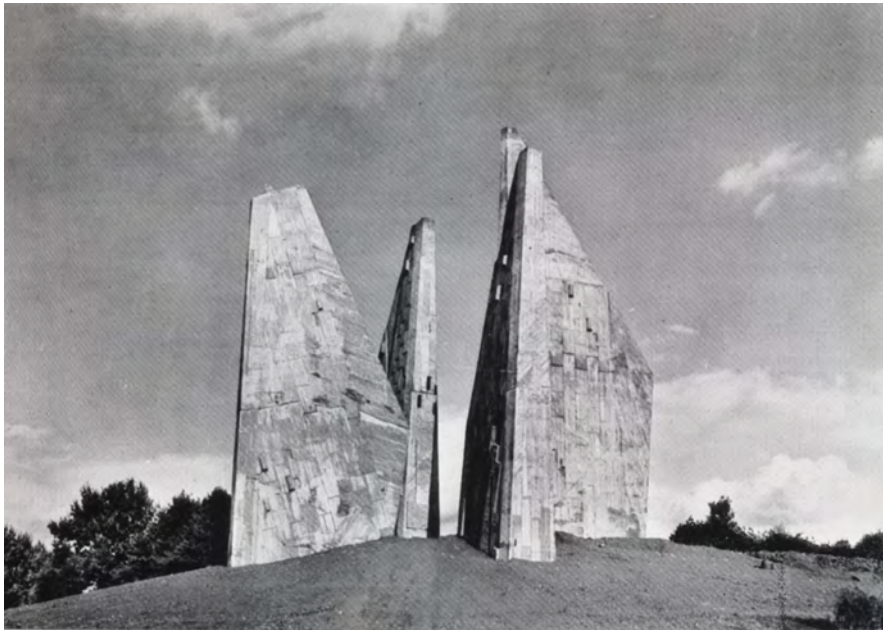
Die „Friedland-Gedächtnisstätte“. Zeitgenössische Postkarte des Verbandes der Heimkehrer

der Friedland-Gedächtnisstätte nahe, dass diese „für die Ewigkeit“ bestimmt sein sollte. Im Unterschied zu den unter anderem durch namentliche Nennung konkreter Personen lokal verorteten, in ihrer Größe eher bescheidenen Erinnerungszeichen an Flucht, Vertreibung oder Kriegsgefangenschaft erhob die Friedland-Gedächtnisstätte den Anspruch, ein zentrales Denkmal zu sein. Und anders als die lokalen Mahnmale versuchte sie, sowohl den Zweiten Weltkrieg als auch die Kriegsfolgen zu bilanzieren.