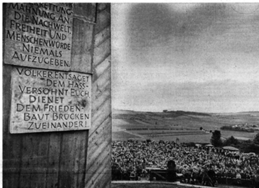
Blick vom Mahnmal auf die Teilnehmer bei der Einweihung der Friedland-Gedächtnisstätte.