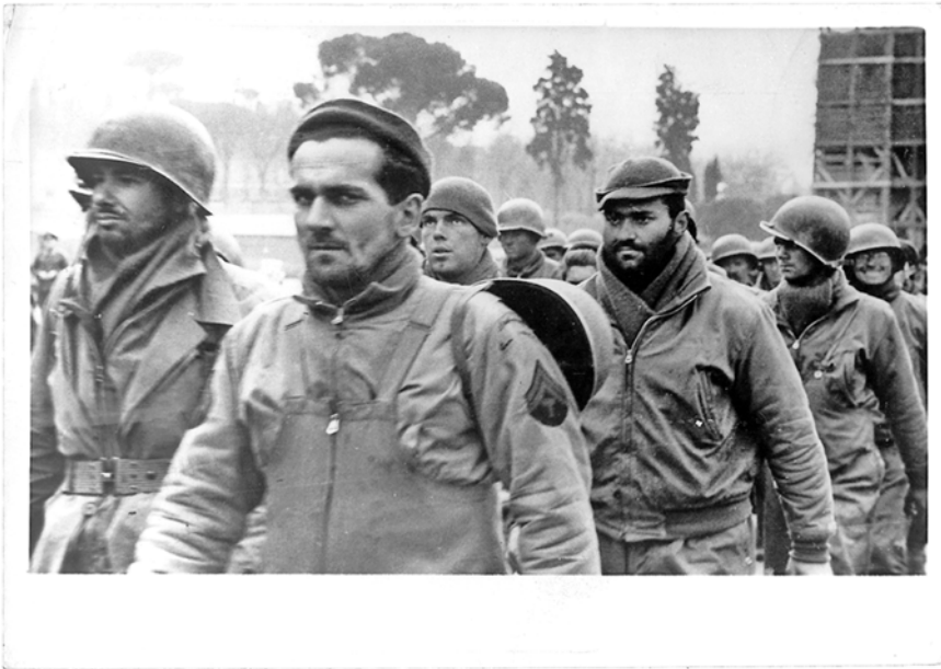
Amerikanische Kriegsgefangene werden als Kontrast zum nationalsozialistischen Ideal der „Rassereinheit“ visualisiert: PK-Fotograf Seeger, Aufnahme vertrieben über Weltbild (Berlin), Emissionsdatum 6.3.1944. Zeitgenössischer Bildtext: „Als Gefangene in Rom! Chikagoer und New Yorker Typen in Rom als Gefangene deutscher Fallschirmjäger und Grenadiere.“ Archivabzug, Silbergelatinepapier, 13 cm x 18 cm, Vorderseite (Privatbesitz).

Gesellschafts- und zeithistorisch ist hierbei von Bedeutung, dass das nationalsozialistische Bildprogramm eine scheinbare visuelle Evidenz der Rassen- doktrin erzeugte, die im Unterschied zu den sprachlich fassbaren Ideologemen und den nach dem Ende der NS-Herrschaft gerichtlich sanktionierten visuellen Propagandadelikten (Verwendung von Hakenkreuzen o.ä.) noch in den bildlichen Massenmedien der Bundesrepublik relativ ungebrochen tradiert wurde. 73 Die Besonderheit der massenhaft verbreiteten visuellen Botschaften und ihrer ikonologischen Traditionen liegt dabei darin, dass sie vor allem durch ihre Allgegenwart wirksam zu werden scheinen – während Texte vorrangig auf diejenigen wirken, die sie mehr oder weniger gezielt rezipieren.