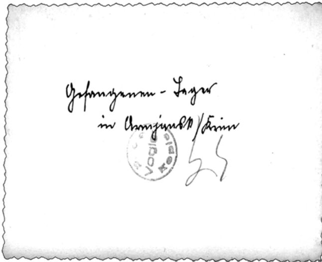
Privater Schnappschuss von 1941, der sowjetische Kriegsgefangene an der Krim zeigt; aus dem Nachlass des an der Ostfront gefallenen deutschen Soldaten R.P.O. Schindler. Silbergelatinepapier, 6,4 cm x 9,2 cm, Vorder- und Rückseite (Privatbesitz). Dass es sich um eine privat hergestellte Fotoaufnahme handelt, ist anhand der Gestalt der Quelle (einschließlich ihrer rückseitigen Beschriftung, die den Aufnahmeort bezeichnet) und ihrer Überlieferungsgeschichte gesichert. Die Intention des Fotografen bei der Aufnahme lässt sich mangels schriftlicher Kontextinformationen zum Bild nicht zweifelsfrei rekonstruieren.