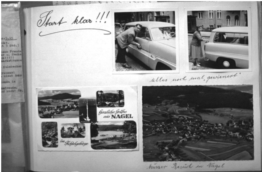
„Alles noch mal ‚gewienert‘“. Autowäsche vor der Abreise, 1965 (HAT, Album S. 10/1965)

Eine wichtige Rolle spielen schließlich symbolische Resümees . Jeder Urlaub wird in den Alben durch eine besonders gestaltete Seite eingeleitet, die das neue Kapitel der fotografischen Lebenserzählung einrahmt: Die großen Rundreisen in den 1960er-Jahren werden durch eine Autokarte mit eingezeichneter Route angekündigt, oft ergänzt durch die Nationalfahnen der durchquerten Staaten. Die späteren, stationären Südtirol-Urlaube beginnen dagegen mit beschaulichen Naturfotos. Abgebildet werden dann oft Übergangsrituale, die das Eintreten in die Welt des Urlaubs und die Rückkehr in den Alltag interpretieren. Für das Berliner Ehepaar wird dabei das Auto fast schon zu einem Fetisch: Vor der Abreise erfolgt – wie bei jedem Ritual – eine zeremonielle Waschung des Kultobjekts, die fotografiert wird.