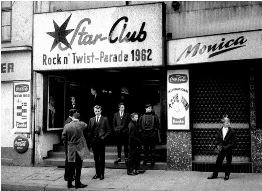
Eingang zum Hamburger „Star-Club“, 1962