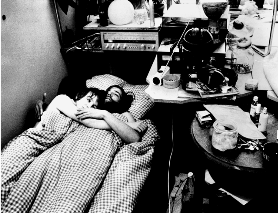
Unterhaltungselektronisch gut ausgestattet: Liebespaar in einer Hamburger Kommune, 1969

„assoziatives Musizieren, das in die aufgebauten Klangbilder und Bewegungsmuster Haltungen, Gesten, Attitüden und Emotionen einlagert, die dem Alltag, der Bildsprache der Medien, der Mode usw. entnommen, weder übersetzbar noch verbalisierbar, auch nicht von den sozio-kulturellen Kontexten ablösbar sind, in denen sie ihren Sinn erhalten.“ 14 Dieser ästhetische Zugang zur Welt lässt sich nicht objektiv bestimmen, sondern ist in den „subjektiven Wahrnehmungsweisen und Bedeutungszuweisungen“ der beteiligten Akteure aufzufühlen. 15