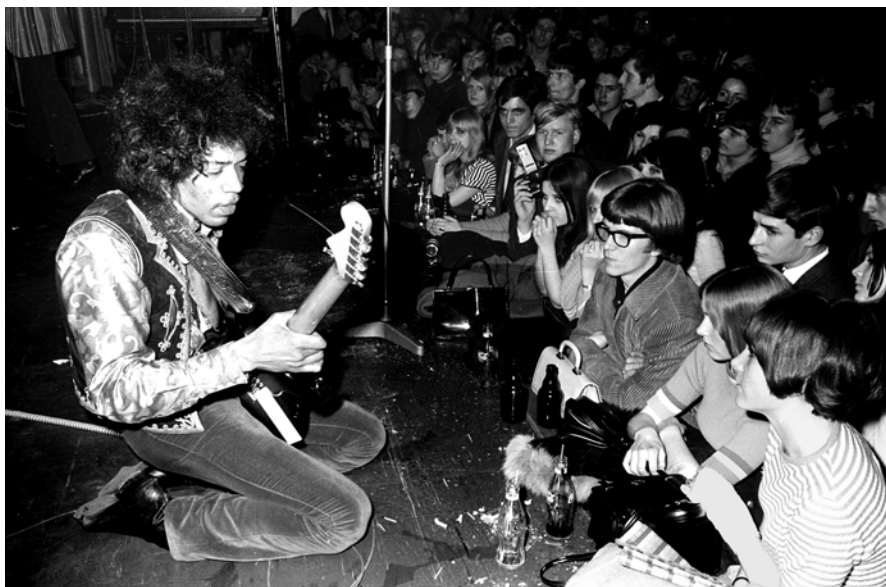
„Das hat uns alle völlig fertiggemacht“: Jimi Hendrix in Hamburg, 17. März 1967